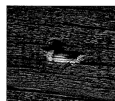
buco del chiodo