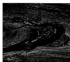
tasca di corteccia/ nodo rotto