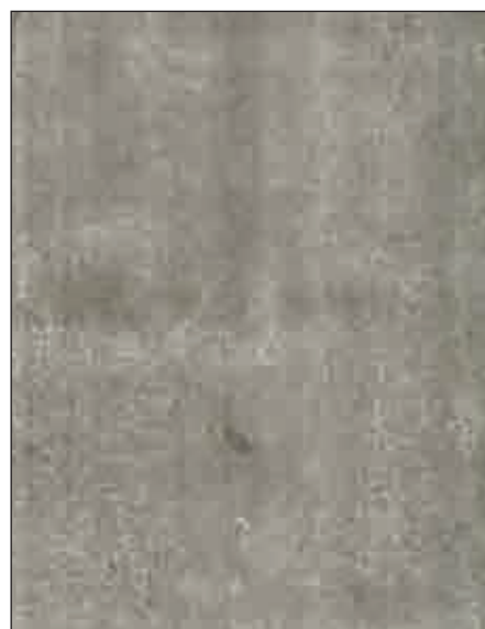
VINTAGE DARK √ bordo abbinato PVC 23x2 mm