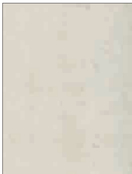
VINTAGE LIGHT √ bordo abbinato PVC 23x2 mm