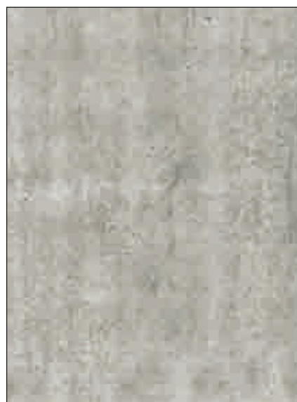
VINTAGE STANDARD √ bordo abbinato PVC 23x2 mm